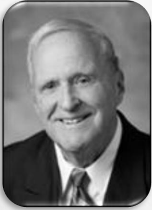
Виктор Врум, «Труд и мотивация», 1964